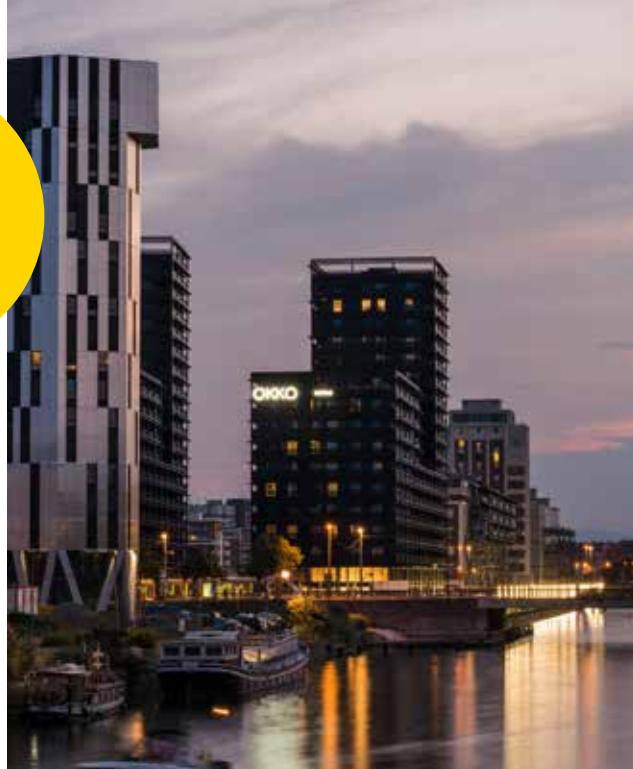
Tour ELITHIS, quartier Deux-Rives

Strasbourg abrite la première tour à énergie positive au monde . Cette tour de logements expérimente de nombreuses innovations qui répondent aux grands enjeux du XXI e siècle : lutte contre le réchauffement climatique, accélération de la transition énergétique, limitation de l'étalement urbain, lutte contre la pollution, intégration positive du numérique dans l'économie de la construction, mieux vivre ensemble.